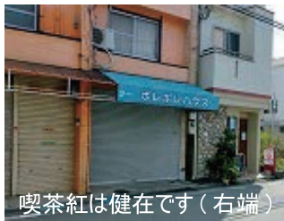
喫茶紅は健在です(右端)