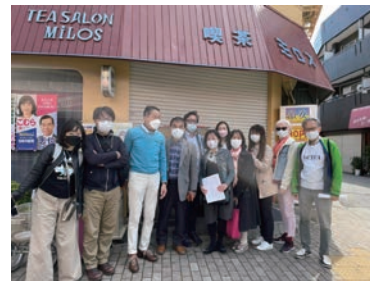
撮影に参加した役員(ミロス前)

この動画を観て頂いた皆様にも、ぜひ映像の中に自身の姿を投影し、同じように不思議な感覚になって頂けたら幸いです。