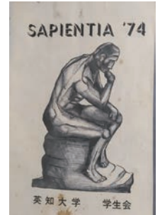
学生会会長のときに発行した機関誌

後には鳥取女子短期大学学長を務められ、IOCからオリンピック功労賞を贈られました。