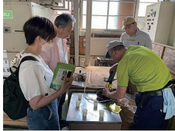
茶工場での三年番茶の試飲風景

手軽なペットボトルのお茶にすっかり慣れてしまっている私にとっては、久しぶりに急須で飲むお茶は新鮮で、この茶工場の香りと相まってとても美味しく頂戴しました。