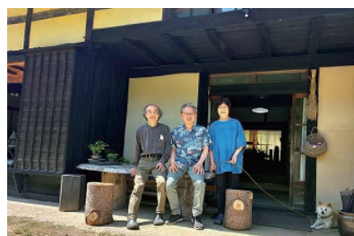
水野ご夫妻と愛犬と私(中央)

泊めていただいた事がありました。部屋に入ると、部屋中本で埋め尽くされており、机の上にも十数冊の本が山積みされていました。畳の上に無造作に置かれた本は既に読み終えた本、机の上の本はこれから読む本とのこと！