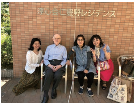
スクルス先生と娘たち

1973年3月志望大学入試失敗、4月英知大学文学部 フランス文学科入学 それほど高い志を抱いていたわけではないのですが、志望大学への入試失敗は、私が生まれてはじめて経験する挫折でした。そして私は、他大学への3年次転校に向けて、周りの一切との親睦を断ち切るように一人孤立して、