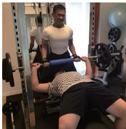
ベンチプレスの補助をする筆者

手ぶらでもお越しいただけるようウェア、タオル、ドリンクなど全て用意、駐車場完備、ゆっくりおくつろぎいただける部屋や整体ル